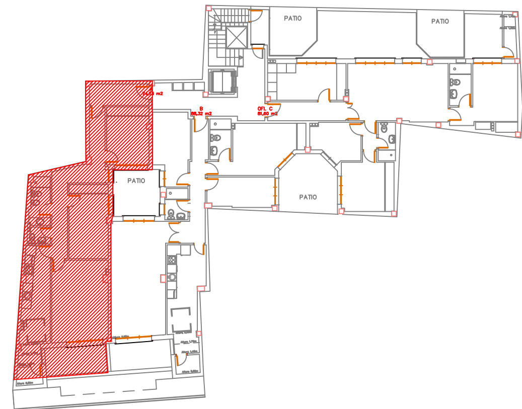
C/ CANONIGO SAN MARTIN N. 7