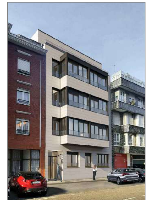
CALLE BLAS DE OTERO N.15