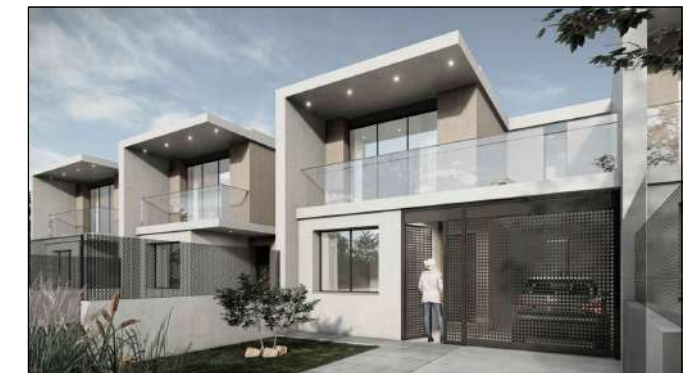
vista fachada principal